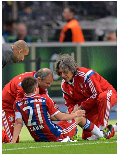
Arzt Müller-Wohlfahrt (r.) bei DFB-Pokalfinale 2014*: »Noch viele Jahre vor mir«

Müller-Wohlfahrt: Ich bin kein Zauderer, ich lebe im Hier und Jetzt und schaue nicht zurück. Negative Gedanken verscheuche ich. Viele meiner Freunde oder Bekannten, die im Alter keiner Aufgabe mehr nachgehen, sind unglücklich geworden oder langweilen